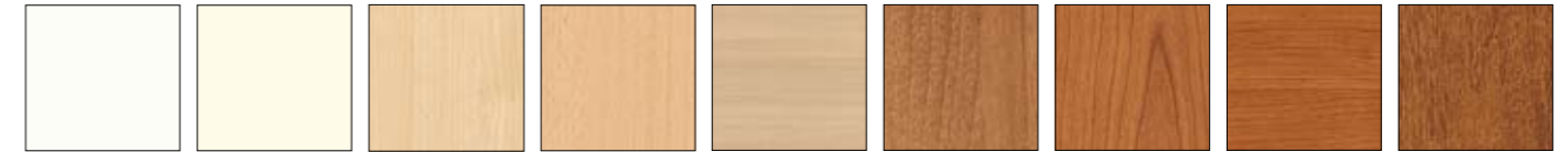
BIANCO WHITE BLANC BLANC BLANCO BLANCO WEISS WEISS AVORIO IVORY IVOIRE IVOIRE MARFIL ELFENBEIN ЦВЕТ СЛОНОВОЙ КОСТИ ACERO MAPLE ERABLE ERABLE ARCE ARCE AHORN KLEH FAGGIO BEECH HETRE HETRE HAYA HAYA BÜCHE БУК ROVERE SBIANCATO BLEACHED OAK CHENE BLANCHI ROBLE BLANQUEADO EICHE GEKALKT ОТБЕЛЕННЫЙ ДУБ NOCE WALNUT NOYER NOYER NOSAL NUSSBAUM OPEX CILIEGIO CHERRY CERISIER CERISIER CEREZO KIRSCHBAUM ВИШНЯ BOCHERRY BOCHERRY BOCHERRY BOCHERRY BOCHERRY BOCHERRY BOCHERRY BOCHERRY MAGNOLIA MAGNOLIA MAGNOLIA MAGNOLIA MAGNOLIA MAGNOLIA