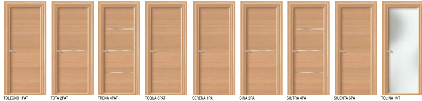
TOLEGNO 1PAT TOTA 2PAT TRENA 4PAT TOQUA 6PAT SERENA 1PA SINA 2PA SIUTRA 4PA SIUENTA 6PA TOLINA 1VT