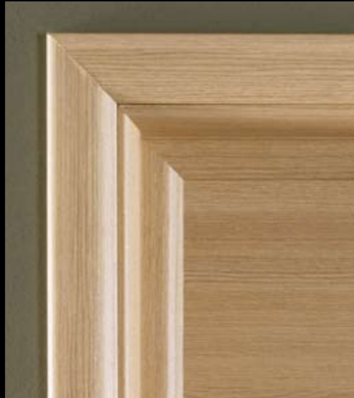
MOD. SERENA 1PA COLORE ROVERE SBIANCATO COLOUR: BLEACHED OAK COLORIS CHÊNE BLANCHI COLOR ROBLE BLANQUEADO FARBE EICHE GEKALKT ЦВЕТ ВЫБЕЛЕННЫЙ ДУБ