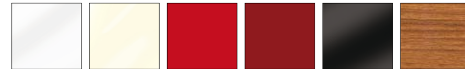
BIANCO LUCIDO WHITE GLOSS BLANC BRILLANT BLANCO BRILLANTE WEISS HOCHGLANZ БЕЛЫЙ ГЛЯНЦЕВЫЙ AVORIO LUCIDO IVORY GLOSS IVOIRE BRILLANT MARFIL BRILLANTE ELFENBEIN HOCHGLANZ СЛОНОВОЙ КОСТИ ГЛЯНЦЕВЫЙ ROSSO LUCIDO RED GLOSS ROUGE BRILLANT ROJA BRILLANTE ROT HOCHGLANZ КРАСНЫЙ ГЛЯНЦЕВЫЙ ROSSO RUBINO LUCIDO RUBY RED GLOSS ROUGE RUBIS BRILLANT ROJA RUBI BRILLANTE RUBINROT HOCHGLANZ РУБИНОВЫЙ ГЛЯНЦЕВЫЙ NERO LUCIDO BLACK GLOSS NOIR BRILLANT NEGRO BRILLANTE SCHWARZ HOCHGLANZ ЧЕРНЫЙ ГЛЯНЦЕВЫЙ TEAK TEAK TEAK TEAK TEAK TEAK

Colori disponibili solo con telaio in alluminio. Colours available with aluminium frame only . Coloris disponibles uniquement avec cadre en aluminium . Colores disponibles sólo para la versión con marco en aluminio . Nur mit Aluminiumrahmen lieferbare Farben . Цвета, имеющиеся только с алюминиевой рамой