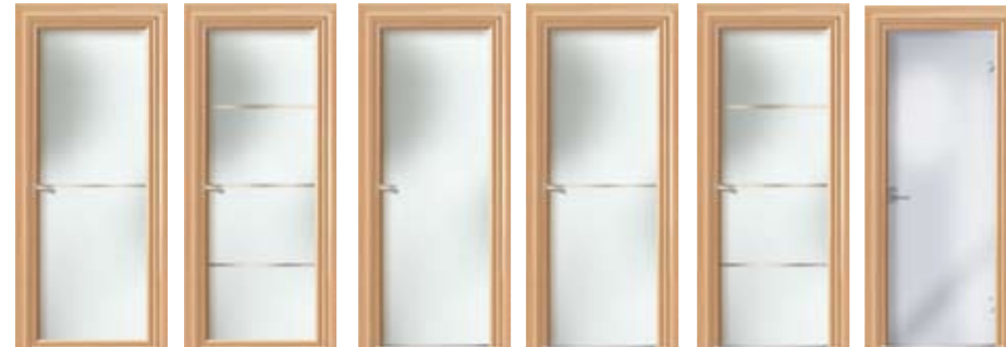
TIUNA 2VT TITRA 4VT VELINA 1V2003 VUNA 2V VIETRA 4V VIA 1TV